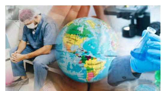
Simposio La salud global: un campo de intereses y tensiones políticas

17 de mayo 14 hora East Coast 15 hora Argentina