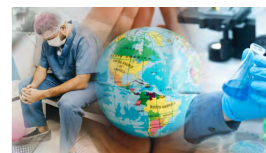
Simposio La salud global: un campo de intereses y tensiones políticas